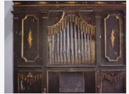
Figura 7. Piano.

Estas modificaciones fueron realizadas durante las obras del Plan de Guanajuato (1965-1968) (García y Trejo, s. d.).