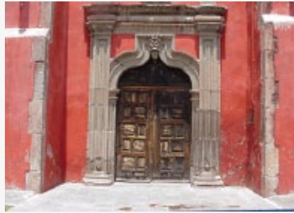
Figura 6. Puerta lateral al Este.