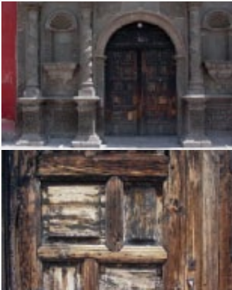
Figura 5. Puerta principal.