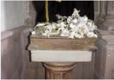
Figura 1. Peana. Señora de la Misericordia.