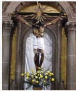
Figura 2. Cruz de madera y Cristo de caña de maíz.